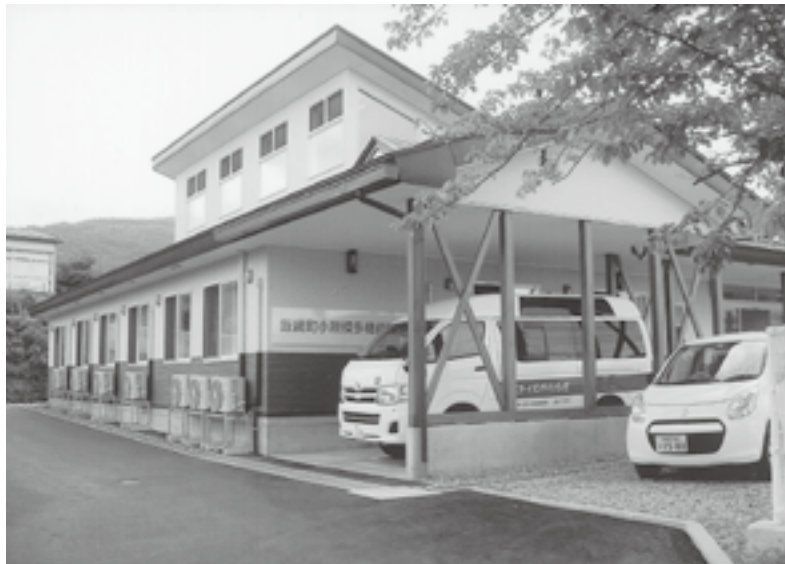
▲野村上に7月にオープンした「小規模多機能型介護施設」 “ニチイケアセンターいいづな”