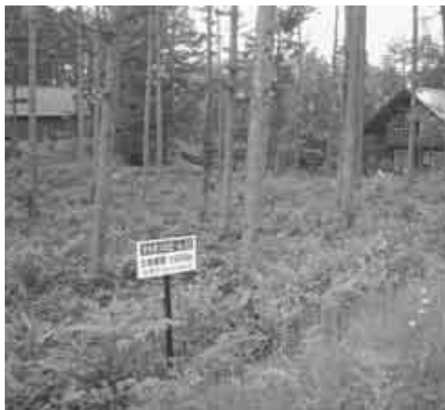
▲環境整備の整ったからまつの丘別荘地

町長 ふるさと振興公社は、町の農業振興において重要であり、運営にかかる部分は、独立財産制を目指しながら町農業を支えたい。