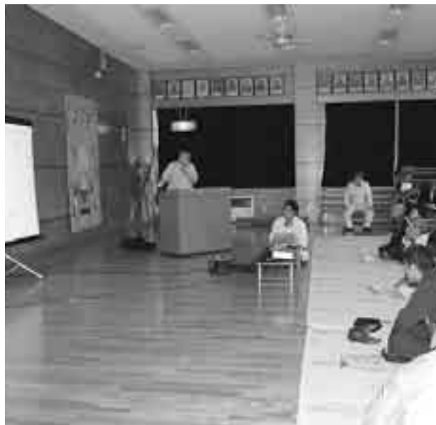
▲倉井地区で行われた地域防災セミナー

仮に大きな災害が起きた場合、大量の「リ災証明」の発行が必要になる。今のままでは確認作業に手間取り、被災者を長時間待たせる等、負担を強