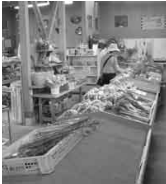
▲見直しが検討されている振興公社（直売所）