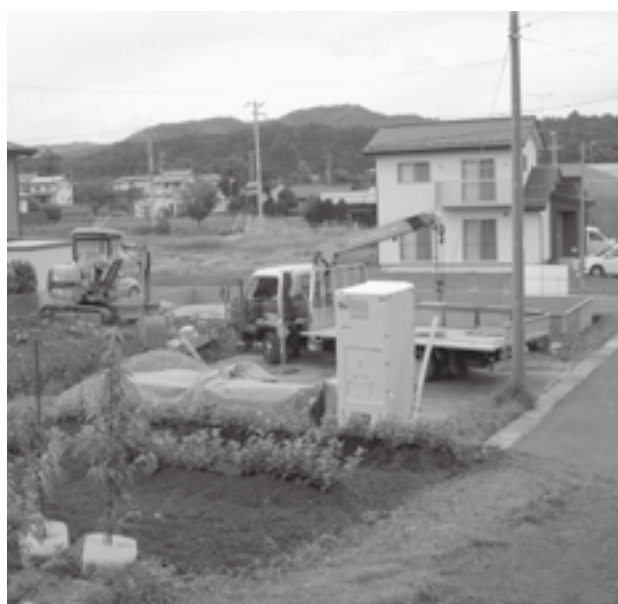
▲住宅用地 峰団地 (倉井)

峰団地で2件、扇平団地で2件。未利用地は普光寺・海洋センター横用地、飯綱病院の駐車場用地、国鉄清算事業団から取得した土地など。