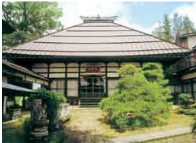
▶大正12年まで役場だった健翁寺

三水村の村名は、「区域中三条ノ用水路アリテ灌漑最モ親密ノ関係ニアル」ことから名づけられた。