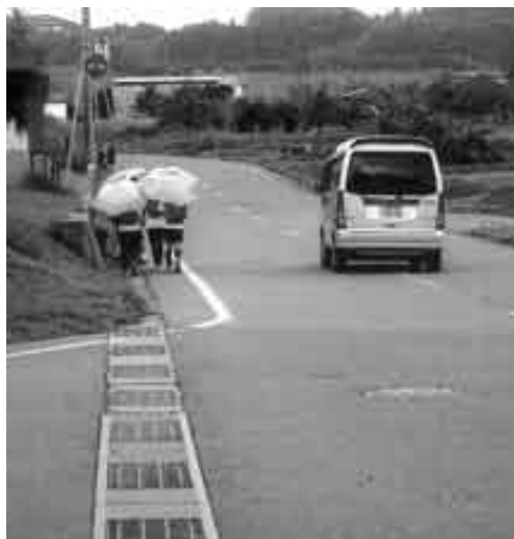
▲ 車に背向け左側を歩く児童

黒柳 牟礼東小区内の飯網病院南からふれあいパーク下表町交差点までの通学路は、下校時に車に背を向けて左側を歩い