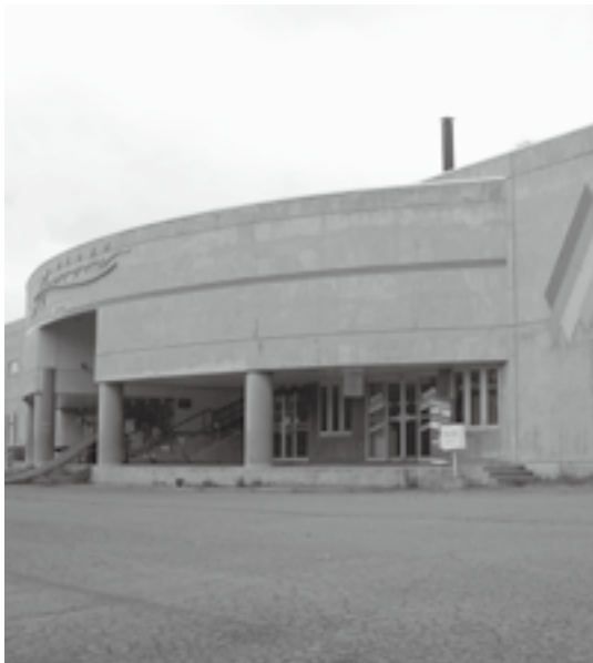
▲スキー場施設「プラザオーロラ」

いが設備の修理の一部を負担し、賃貸料を町民益のために増額し請求するべく補正を組んだ。 新年度予算が可決されていらない委員会では補正を発言されるのは、認識不足だ。 委員会では、契約できたら早急に補正を出すと言った。決して議会のないがしろにしてい