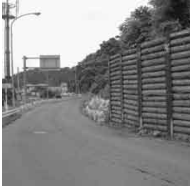
▲改良工事が進む荒瀬原線（栄町）

神谷 旧三水村と旧牟礼村が合併した。高架橋の建設は町民の交流はもとより、中学・高校生の通学の利便性、飯綱病院の救急患者搬送のスピード化、りんごパークセンターや町民会館での行事の利便性、長野市への買い物や通勤効果が大きい。町長はこの高架橋建設に積極的に取り組む考えは、 町長 栄町区からの歩道の申請工事を優先する。 神谷 前町長は県へ高架橋建設を要望してきた。 町長 引き継ぎを受けていない。 神谷 業務引き継ぎに問題ある。