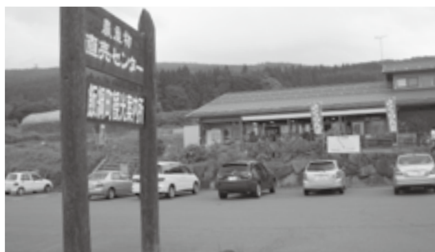
◀直売センター「横手」