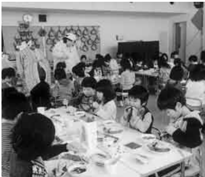
▲ 保育園の給食風景