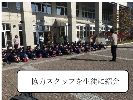
協力スタッフを生徒に紹介