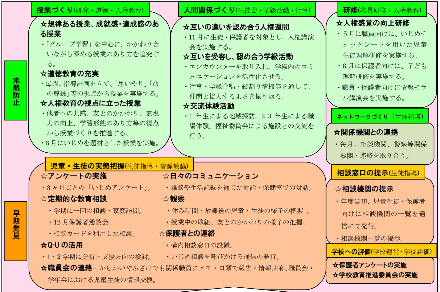
別表4 いじめ未然防止、早期発見、早期対応等に関する取組