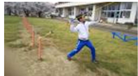
【バトンスローを試す様子】