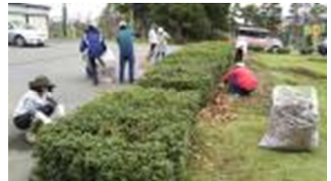
【落ち葉の片づけの様子】