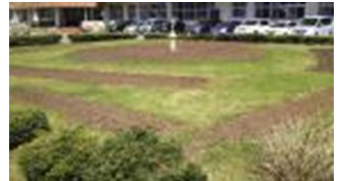
【肥料を入れ耕された花壇の様子】