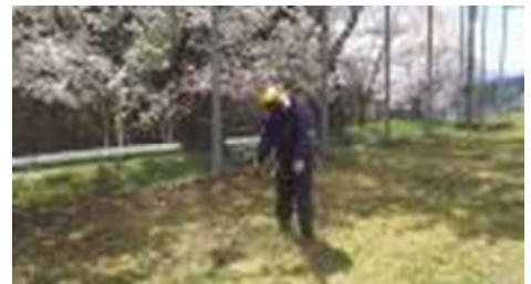
【校庭の草刈りの様子】