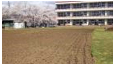
【肥料を入れて耕された畑の様子】