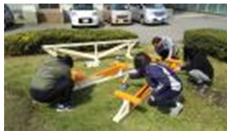
【平均台を手作りしている様子】