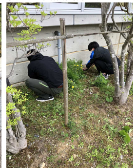
環境整備作業(5月15日)