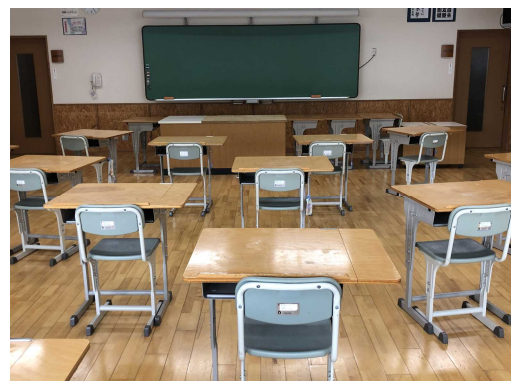
分散登校日に向けた教室の準備(美術室)

このように、生徒の皆さんがいつ学校に戻ってきても大丈夫なように、様々な準備をしています。