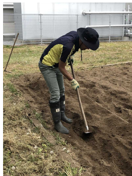
科学クラブの畑の準備