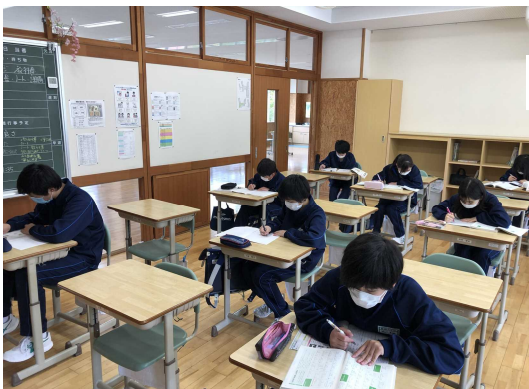
飯網中学校教室の様子

5月25日(水)に飯網町内に4つのサテライト教室を開設しました。各教室に本校職員を派遣し、生徒の家庭学習の支援を行いました。4つの教室の午前の部、午後の部に、延べ175人の生徒が参加しました。今後、万が一、感染の影響で臨時休業が再開した場合は、再度サテライト教室を開設し、生徒の学習支援を行います。