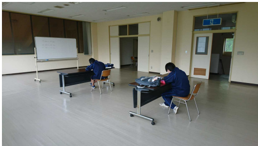
天狗の館管理棟教室の様子