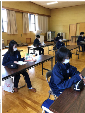
赤塩コミュニティ消防センター教室の様子