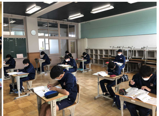
旧牟礼西小学校教室の様子