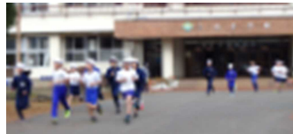
【5・6年生のマラソンの様子】