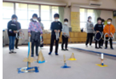
【さみずっ子まつりの様子】

11月20日(金)に「さみずっ子まつり」を行いました。児童会の各委員会が出店して、全校児童がなかよしになる内容を考え、実施しました。今年度は、コロナ禍のため、感染予防をしっかり行い、笑顔あふれる時間となりました。