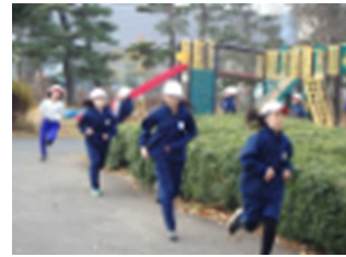
【3・4年生のマラソンの様子】