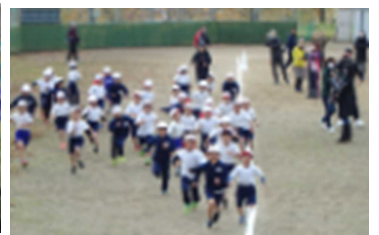
【1・2年生のマラソンの様子】