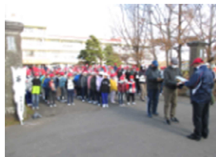
【校門へ避難する様子】