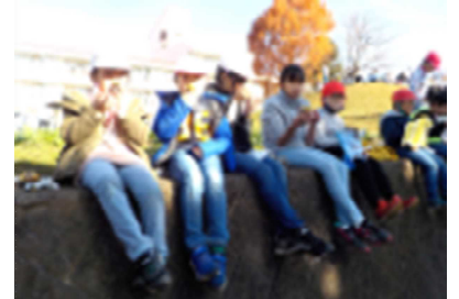
【やきいも会の様子】

また、同日開催の予定でしたが悪天候のため延期した「やきいも会」を、25日(水)に行いました。班ごとに向かい合わせにならないように気をつけながら、ホクホクの焼き芋をいただきました。楽しくおしゃべりしながら…というわけにはいきませんが、全校児童で焼き芋を食べられる「幸せ」を感じることができました。