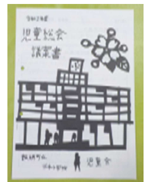
【児童総会の議案書】

1月28日(木)に、選挙管理委員会が中心となって立会演説会(3～6年生参加)を行いました。2名の候補者は、「こういう三水小学校にしたい」と自分なりの考えや決意を、そして、各推薦責任者は候補者の推薦理由をそれぞれ述べました。その後、一人一票を真剣な表情で投じ、児童会長、副会長が決まりました。また、2月18日(木)に、第1回の児童総会が行われました。例年4月に行われる第1回児童総会ですが、臨時休業のため中止でした。今年度は、6月に議案書を配付し、質問や意見を聞いたうえで1年間の活動を承認してのスタートでした。6年生にとっては、最初で最後の児童総会でした。初めて児童総会に参加した3年生にとっては、堂々と発表や発言をする先輩たちを頼もしく感じたことでしょう。4・5年生にとっては、高学年の自覚を更に高めたことでしょう。