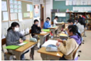
【児童会引き継ぎの様子】