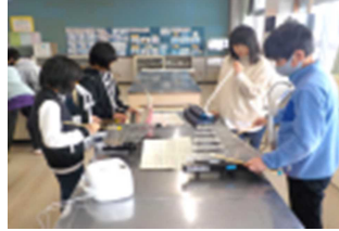
【鼓笛隊のグロッケン隊・小太鼓隊の引き継ぎの様子】