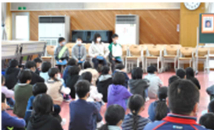
【立会演説会の様子】