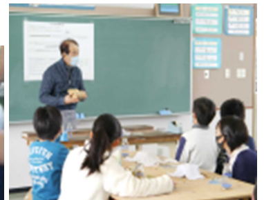
【図工（ねん土）で鉛筆立てを作っている様子】