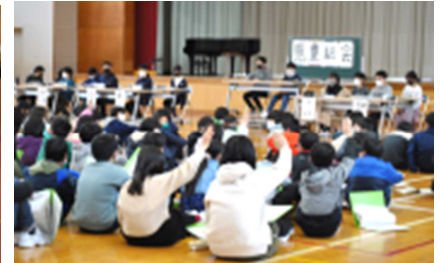
【第1回児童総会の様子】

1月28日(木)に、選挙管理委員会が中心となって立会演説会(3～6年生参加)を行いました。2名の候補者は、「こういう三水小学校にしたい」と自分なりの考えや決意を、そして、各推薦責任者は候補者の推薦理由をそれぞれ述べました。その後、一人一票を真剣な表情で投じ、児童会長、副会長が決まりました。また、2月18日(木)に、第1回の児童総会が行われました。例年4月に行われる第1回児童総会ですが、臨時休業のため中止でした。今年度は、6月に議案書を配付し、質問や意見を聞いたうえで1年間の活動を承認してのスタートでした。6年生にとっては、最初で最後の児童総会でした。初めて児童総会に参加した3年生にとっては、堂々と発表や発言をする先輩たちを頼もしく感じたことでしょう。4・5年生にとっては、高学年の自覚を更に高めたことでしょう。