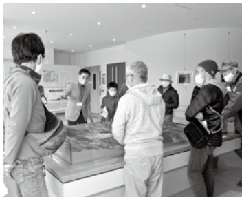
当日の様子 (眺望と新設パネルと地形模型から山々の成り立ちを学ぶ)

歴史ふれあい館では、昨年秋に3階を『五岳の部屋』に模様替えし、春以降自粛していた講座を再開しました。この部屋では、北信五岳の景色を眺め、山々の成り立ちを知ることができます。当日は1回の定員を15名とし、入れ替え制で3回の講座を行い、山々とその町の自然の歴史や謎についてお話ししました。