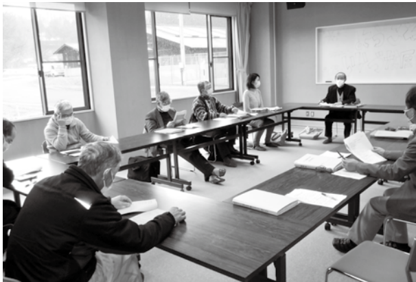
歴史ふれあい館協議会の様子 (当館小ホールにて)

協議会構成やこれまでの検討内容、「町の歴史文化の拠点づくり構想」については、町のホームページ ( https://www.town.iizuna.nagano.jp ) からご覧いただくことができます。