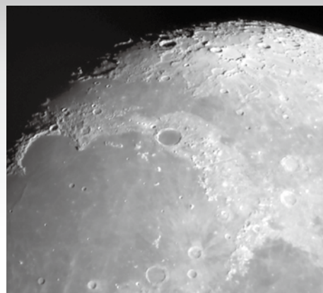
2020年10月27日の月面 （当館の望遠鏡で撮影）

5月 8日（土）・22日（土） 6月12日（土）・26日（土） 7月10日（土）・24日（土） 8月14日（土）・28日（土） 9月11日（土）・25日（土） 10月 9日（土）・23日（土） 11月13日（土）・27日（土） 3月26日（土）