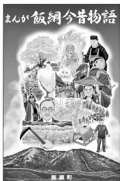
大好評の 「まんが飯綱今昔物語」

飯綱町が発足した平成17年10月から令和2年4月まで飯綱町広報誌に連載された「まんが飯綱今昔物語」の単行本化を記念して開催しました。当日は本を開きながらの歴史講座や、単行本化を町に提言した「飯綱今昔物語発刊委員会」の方を交えたトークディスカッションが行われ、この本を次の世代へのメッセージとして活用してほしいという願いが語られました。