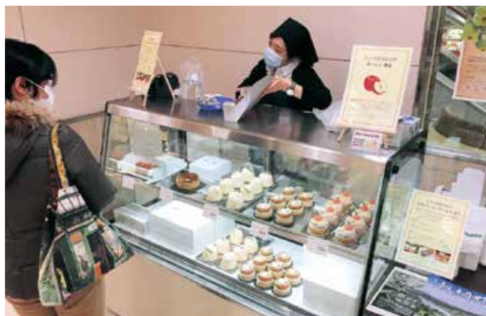
▲ながの東急百貨店の食品売り場の様子