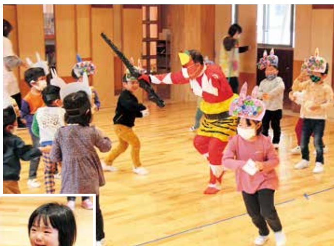
▲未満児さんが見学する中、鬼退治するおにいさん、おねえさん