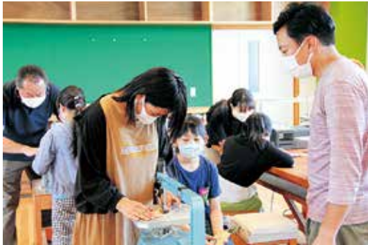
▲小学校のワークショップの様子

町内の施設の家具の制作ワークショップのかたわら、材料である木について考えるようになりまし。そこで林業研修を受講し、林業に携わる方から日本の林業における現状、課題を学びまし。それは飯綱町も例外ではありません。木材の価格が下落し林業を続けるのが厳しくなり、山林の整備が追いつかない状態になっているのです。このままでは森林はどんどん荒廃していき、木材として活用できるようにするのはとても厳しい状況です。