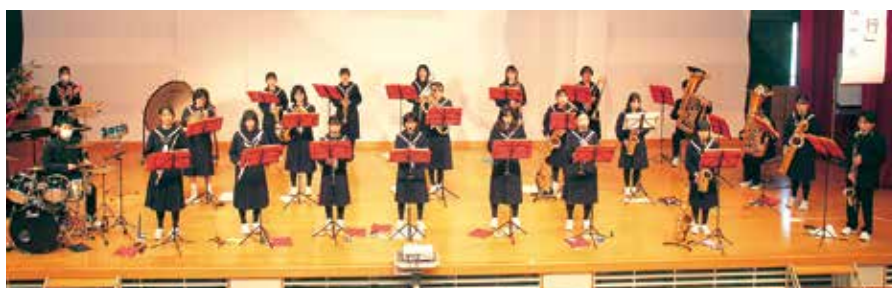
▲飯綱中学校吹奏楽部が校歌を含む5曲を演奏しました