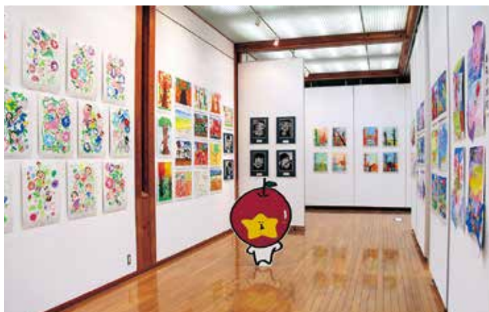
▲子どもたち一人ひとりの「思い」が込められた作品の数々