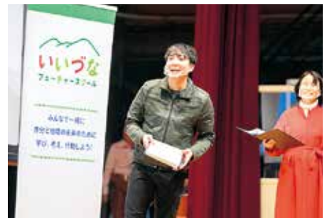
▲いづな事業チャレンジのプレゼンの様子