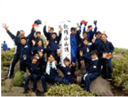
【飯縄山山頂の様子(6年1組)】