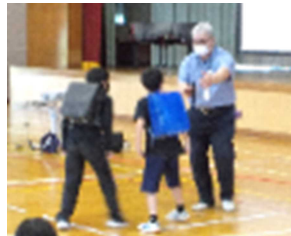
【不審者対応訓練・防犯教室の様子】

6月21日(月)に、不審者が来校したことを想定しての不審者対応訓練と防犯教室を行いました。また、長野中央警察署の警察官を