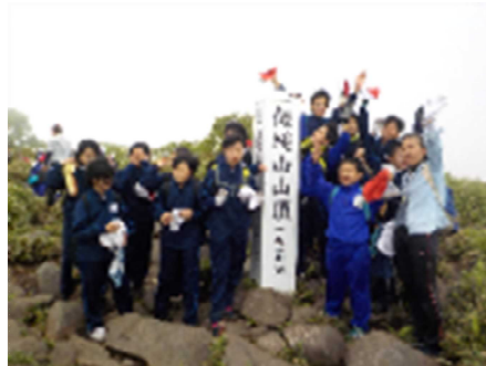
【飯縄山山頂の様子(6年2組)】