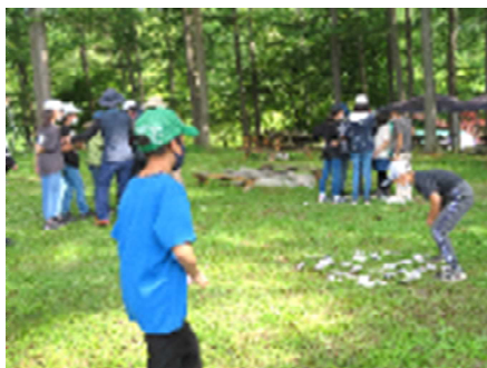
【ネイチャーゲームの様子(5年生)】