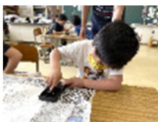
【朝露で墨をする様子】

7月5日（月）に、地域の方から竹をいただき、七夕飾りを作りました。畑で集めた朝露を使って墨をすり、割りばし鉛筆で一人一人願い事を短冊に書いて飾りました。願いが叶いますように。