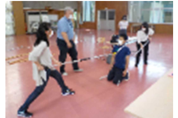
【不審者対処法研修の様子】