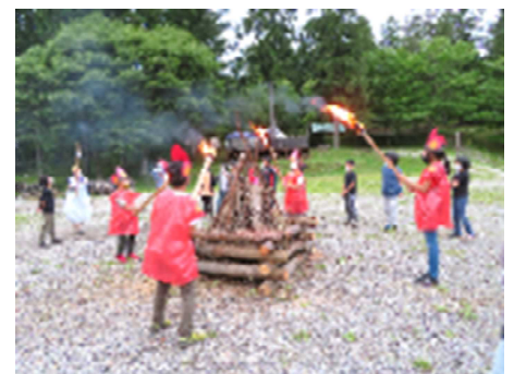
【タベのつどいの様子(5年生)】

7月1日(木)、2日(金)の高原学校に行ってきました。(泊なし)一日目は、昨年度コロナ禍で中止となった6年生と5年生が合同で飯縄山登山を行いました。アザミやツツジ等のきれいな花を見ながら、風のさわやかな音やウグイスの鳴き声も聞きながら自然を満喫することができました。一瞬でしたが、飯縄山の頂上から赤い屋根の三水小学校を見ることができました。梅雨の時期でしたが、二日目も奇跡的に予定していたイベント全てを行うことができました。