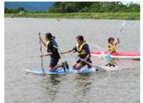
【カヌー・カヤック体験の様子(5年生)】