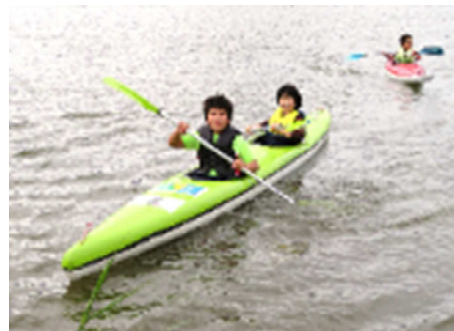
【カヌー・カヤック体験の様子(5年生)】

7月1日(木)、2日(金)の高原学校に行ってきました。(泊なし)一日目は、昨年度コロナ禍で中止となった6年生と5年生が合同で飯縄山登山を行いました。アザミやツツジ等のきれいな花を見ながら、風のさわやかな音やウグイスの鳴き声も聞きながら自然を満喫することができました。一瞬でしたが、飯縄山の頂上から赤い屋根の三水小学校を見ることができました。梅雨の時期でしたが、二日目も奇跡的に予定していたイベント全てを行うことができました。