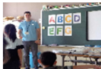
【ALTの先生と学習する様子】

新しい学習指導要領となり、5・6年生は「外国語(英語)」、3・4年生は「外国語活動」、1・2年生は「国際交流」の授業として、英語専科の先生とALTの先生と学習しています。