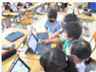
【算数(3・4年生)でタブレットPCを使う様子】