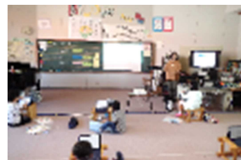
【音楽の授業で活用する様子】