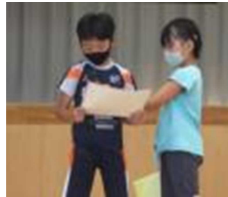
【目標を発表する2年生】

8月20日(金)に、2学期始業式を行いました。2年生の代表児童2名が、2学期の目標を発表しました。「漢字をきれいに書く」「大豆の観察や世話をがんばる」といった学習のことや「音楽会やマラソン大会を一生懸命頑張る」といった行事のことなど、2年生としての目標が発表されました。続いて、校長からは、4年生の算数学習で触れる「不思議な輪」と関連して「メビウスの輪」について、彫刻作品の紹介や実演を交えて紹介しました。一人一台配付されたタブレット端末を活用したりして「ひとりで、みんなで、調べて、聞いて、やってみて、考えて」いろいろな学習に取り組む2学期をめざします。