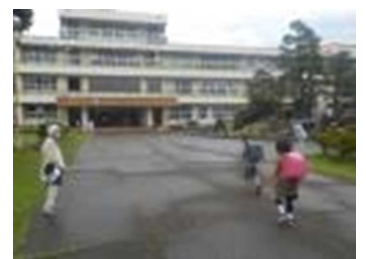
【婦人会の皆様と挨拶する様子】

また、児童会の代表委員会では、毎朝玄関前で「あいさつ運動」に取り組んでいます。元気で明るいあいさつをした友だちを、お昼の放送で紹介しています。2学期も、明るく元気いっぱいの三水小学校にしましょう。