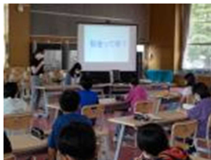
【税金について学習する様子】

7月13日(火)に、社会科学習として長野税務署管内租税教育推進協議会の方に来校していただき、税金の種類や消費税の仕組み、税金の使われ方について学習しました。税金がないと、火事の時に消防士に火を消してもらったり、事件や事故の時に警察官に助けてもらったりした場合にお金が必要なこと。小学生は教育費として年間約88万円の税金を使っていること。消費税は年間約20兆円納められていること等教えていただきました。授業後に、「税金の大切さがわかりました」「税金を納めるのは義務で、支え合いなんだ」「大人になったら、子どもたちや社会のために、責任をもって納税したい」といった感想が寄せられました。