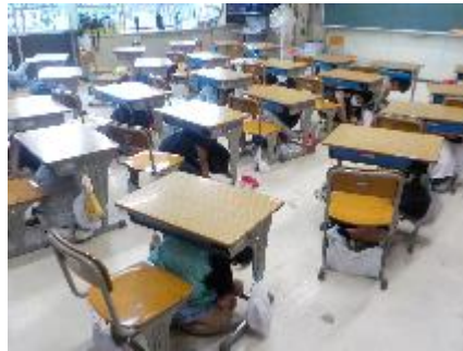
【教室で基本行動をとる様子】