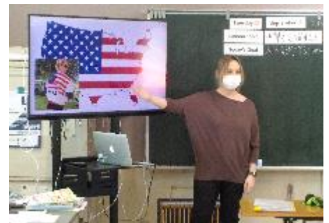
【6年生の教室で自己紹介する様子】

今までの外国語(5.6年生)、外国語活動(3.4年生)、国際交流(1.2年生)の先生(ALT)に代わって、9月中旬~新しい先生(アメリカ テキサス州)と学習をしています。ピザが大好きだそうです。よろしくお願ひします。