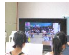
【2年生と Zoom で交流する様子】

5 年生：音楽練習、交流会 鍵盤ハーモニカやリコーダーの代わりにタブレット PC のキーボード等を使って、合奏のパート練習に取り組んでいます。また、児童集会や他学年との交流会では、Zoom を利用して発表し合ったりしています。