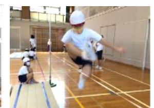
【走高とび練習の様子】

5 年生：音楽練習、交流会 鍵盤ハーモニカやリコーダーの代わりにタブレット PC のキーボード等を使って、合奏のパート練習に取り組んでいます。また、児童集会や他学年との交流会では、Zoom を利用して発表し合ったりしています。