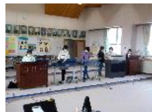
【タブレットを使って合奏練習をする様子】

6 年生：小学校最後の音楽会 楽譜とリズムや音階が流れてくるように設定したタブレット PC を使い、個人やグループでの練習を続けています。6 年間で最も難しい曲にチャレンジしています。