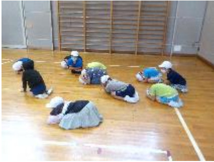
【体育館で基本行動をとる様子】