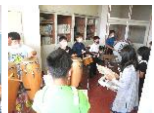
【合奏練習をする様子】

6 年生：小学校最後の音楽会 楽譜とリズムや音階が流れてくるように設定したタブレット PC を使い、個人やグループでの練習を続けています。6 年間で最も難しい曲にチャレンジしています。