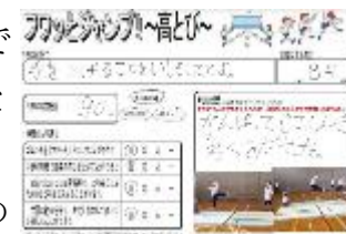
【写真の入った学習記録カード】

4 年生：体育「走り高とび」 4 年生で学習する走高とびは、3 歩助走と片足着地（はさみとび）です。タブレット PC で写真を撮ったり、記録を書いたりして、フワッと浮力感を感じる走り高とびの技能向上につなげています。