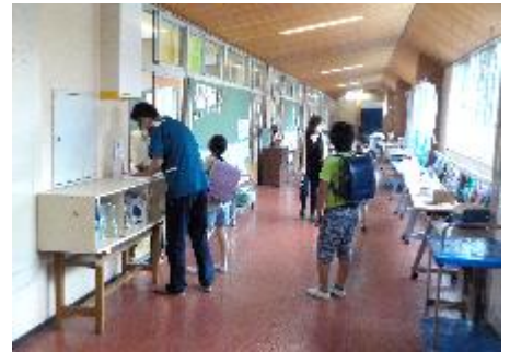
【引き渡し訓練の様子】

9月1日(水)の防災の日に合わせて、第3回避難訓練(地震)と飯綱町保・小・中合同引き渡し訓練を行いました。以前の地震対応訓練では、校内放送「机の下に身を隠しなさい」の指示で避難行動をとる訓練でしたが、実際はそれでは遅すぎます。放送や教師の指示を待たず自ら判断し、基本行動をとるための訓練でした。その際のポイントとして ①上からものが落ちてこない ②横からものが倒れてこない ③ものが移動してこない 場所を見つけて身の安全を確保しました。午後の引き渡し訓練では、雨の中ご参加、ご協力ありがとうございました。様々な理由で引き渡しになることが想定されます。年度途中でも、緊急時に引き受ける方や連絡先が変更になった場合は、担任にお知らせください。