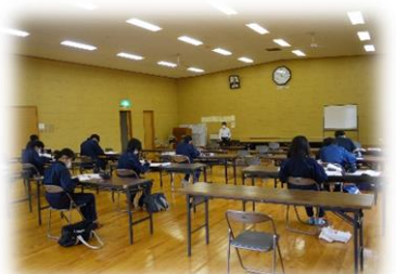
赤東コミュニティ