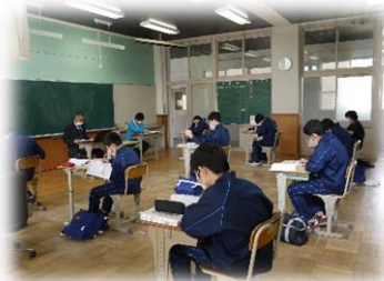
旧傘礼西小学校教室