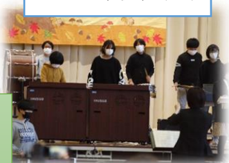
三水小学校音楽会

二学期も予定していた学校行事が、感染対策を取りながら行われました。小学校の音楽会（10月28日）は前半後半に保護者が分かれて参加しました。飯綱校祭（9月30日）はオンライン中継で家庭に配信されました。