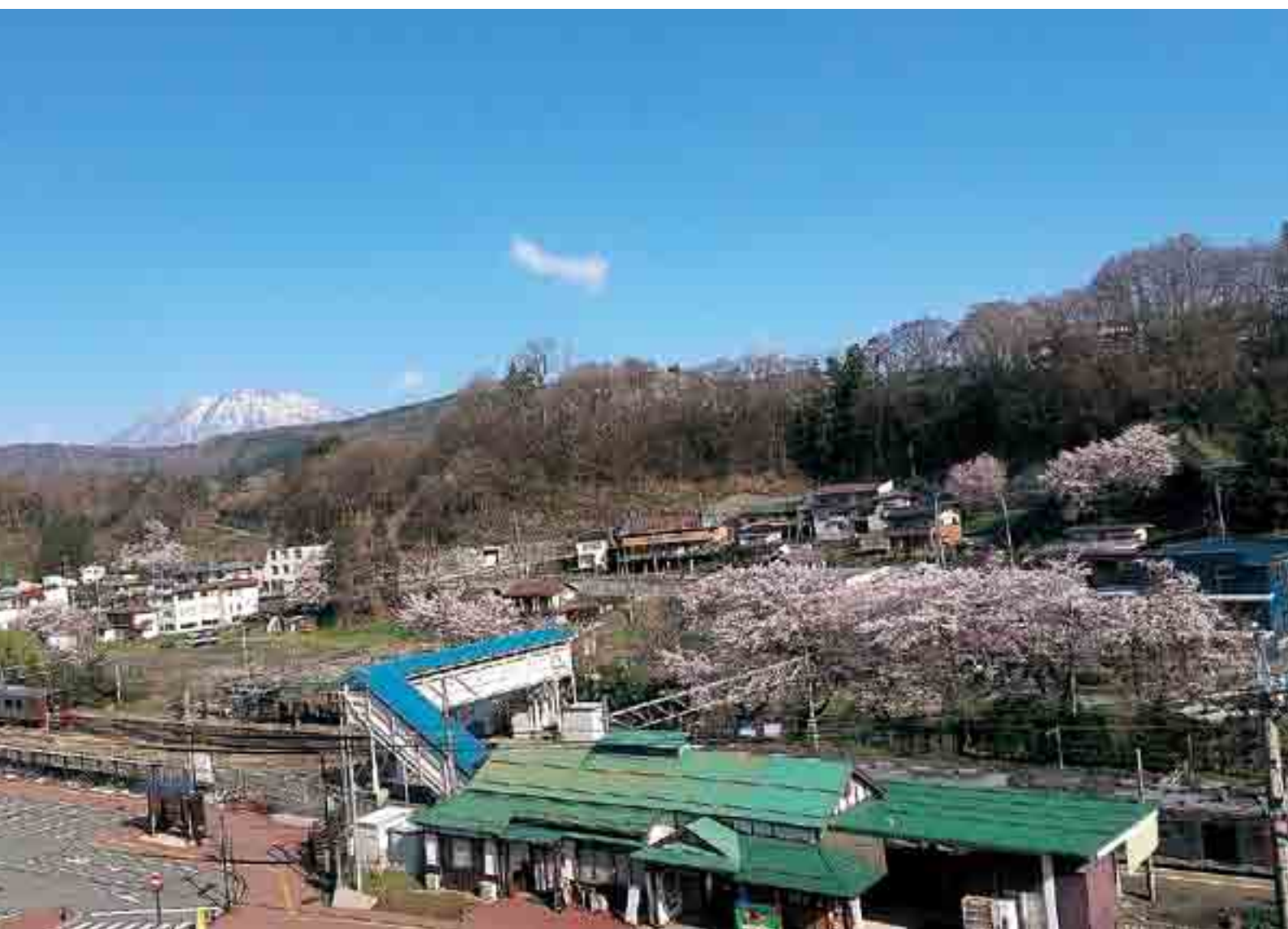
新年度のスタート！ しなの鉄道の利用者を桜の花で迎え入れる牟礼駅