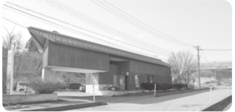
田園風景に溶け込む三水郵便局

よそ24000ヶ所あります。飯綱町にも三水郵便局の他に牟礼郵便局、高岡郵便局、福井団地郵便局があります。郵便局は皆さんの生活に無くてはならない存在になってきていると思います。