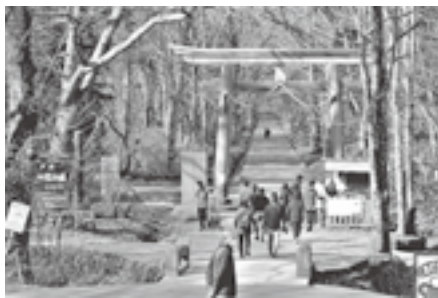
奥社参道の大鳥居と鳥居川を渡る石橋

飯綱町には鳥居川、斑尾川、八蛇川、滝沢川という4本の一級河川があります。一級河川とは、国土交通大臣が指定した「国土と国民生活にとって特に重要な川」のことです。これら4本の川の源流域の話題です。