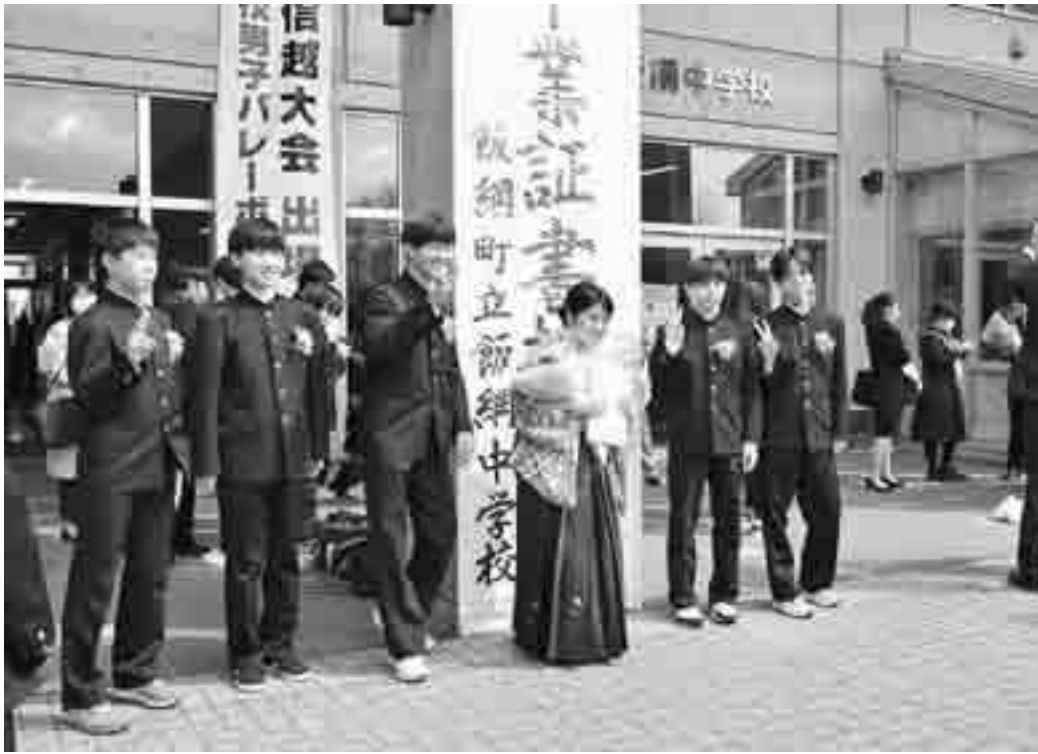
マスク着用でも思い出に残る卒業式

近況や昔話に花が咲き、活力を見出すことができました。今回取材した5名の高校生はじめ、その同級生の皆さんも、これからの生活において、いい仲間がさらにできることを祈念します。そして将来、各々の生活場所から飯綱町へ力添えをもらえることを願います。