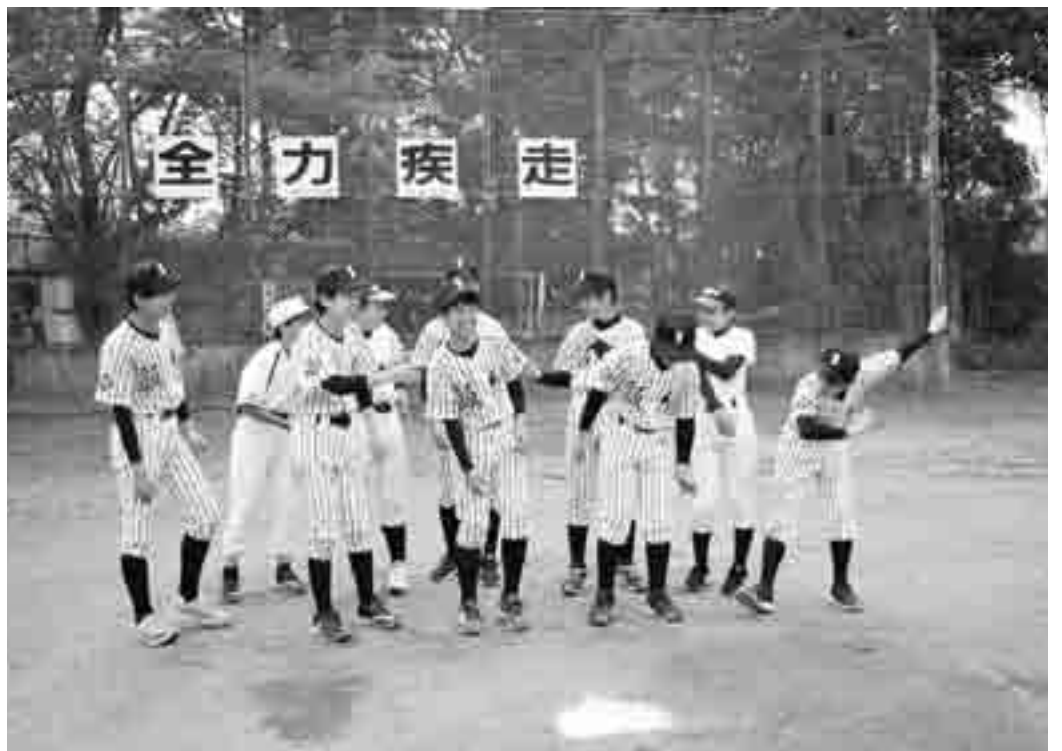
できないことが多い中、最後の試合をやりきってみんな笑顔に！