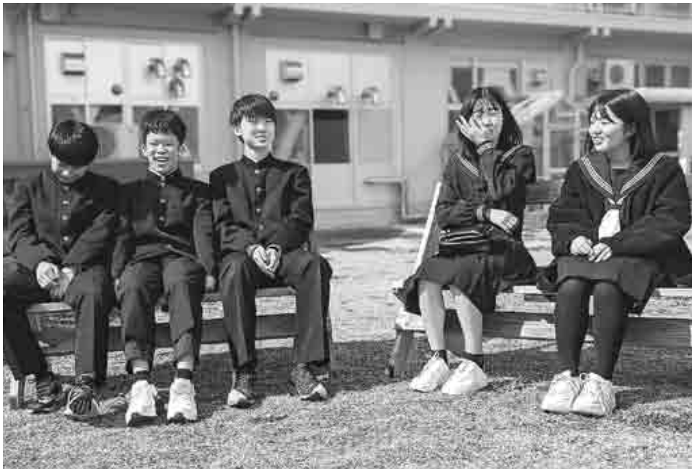
笑顔が語る思い出の3年間