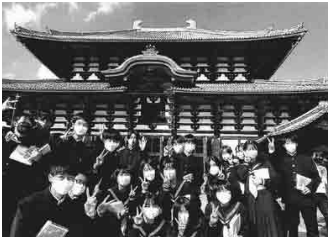
やっと思えた修学旅行

飯綱中学校入学後間もなく、新型コロナウイルス感染症の影響により、約2カ月間の休校。その後も、新型コロナウイルス