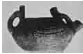
町の有形文化財に指定された考古資料「注口土器」

今、私たちが快適な暮らしを営んでいる飯綱町に狩猟採集生活をしながら暮らしていた縄文人がいたのかあーと思うと不思議な感じですね。この時に出土した完全な形の注口土器(現代の急須のような形)は、町の文化財として保存されています。