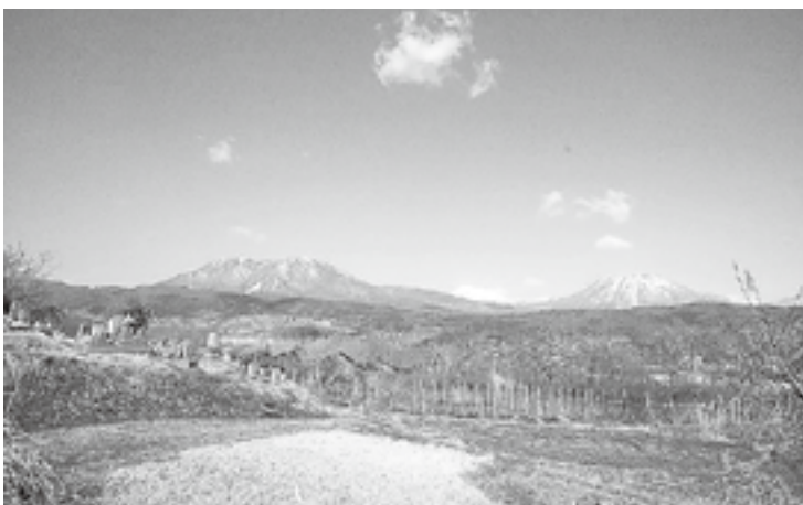
青空の下の飯綱山を望む

な場所がココです。三本松の信号から飯綱病院に行く途中で、急に視界が広がる所です。飯綱・戸隠・黒姫・妙高・斑尾の北信五岳がくっきりと見えます。その下には、小玉や三水地区の田畑や家々が拡がり、上を見ればどこまでもずっと空が続いています。「飯綱町って美しいなあ」と通る度に思っています。縁があつて初期の福井団地の住民となりました。この道路が開通したのは数年前ですが雪の時も花の時も濃緑や紅葉の時も、晴れている日はもちろん、雨の日もそれなりに趣があつてステキです。