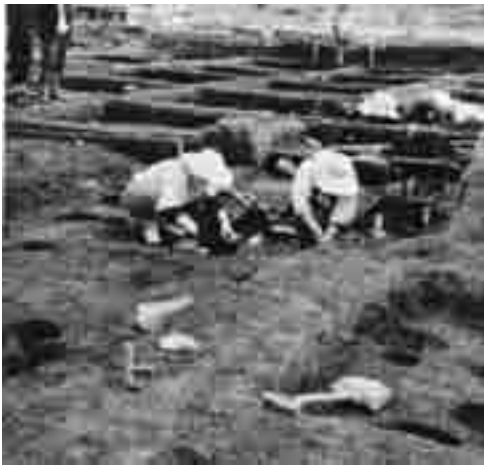
三水地区芋川の小野遺跡発掘現場(1975年)

かつて、飯綱町のリンゴ畑の下から考古資料が発掘されたというロマンあふれるお話がありました。そのことがリンゴ農家の人たちの間などでも郷土愛を掘り起こすきっかけとなったのかどうかは分かりませんが今から百年前は大正時代、200年前は江戸時代で千年前は平安時代、さらに2千年前は縄文時代で約1万年前から続いています。この頃に用いられた縄文式土器や打製石器は約50年前に飯綱町の小野遺跡から発掘されました。