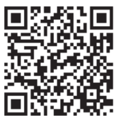
◆ふるさとチョイス