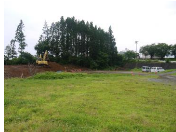
【牟礼小学校駐車場予定地】 【三水小学校駐車場予定地】

牟礼東小学校西側の田畑では駐車場整備工事が始まりました。9月末の完成を目途に進めています。また、三水第一小学校の東側の駐車場も拡幅、舗装工事等の整備工事を行います。10月末の完成を目指し、現在進めています。どちらも工事用車両が出入りしております。工事期間中の通行にご留意願います。