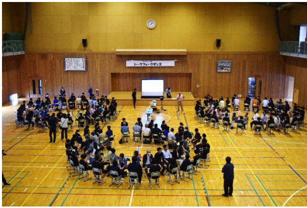
↑トークフォークダンスの様子